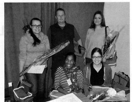
Der SV Inwil freut sich über fünf Neumitglieder.