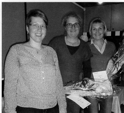
Präsidentin mit Neumitgliedern